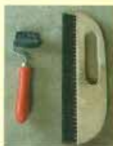
ルナファーザー用 プラスチック製のローラーと なでばけ