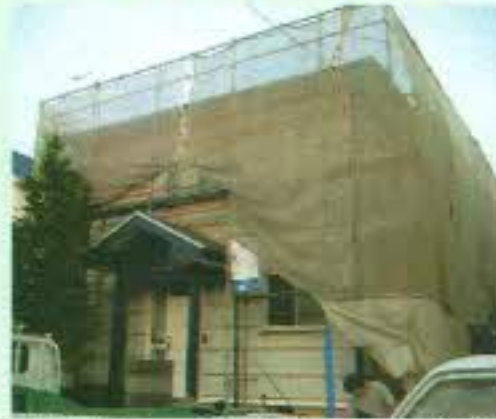
以前の外壁をシートでおおい作業をすすめます。

「工事中から外観がどう変わるかとても楽しみでした。塗装と比べると工期は長いとの事でしたが、出来上がりは全くイメージが変わり新築気分を味わっています。歳月が経っても色あせが少なく、古めかしくならないというのもメリットだと思います。会社が近いのですぐにとんで来てくれるし、職人さんも良くやってくれて満足しています! おすすめです!」