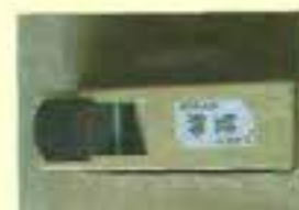
カンナ 床にPタイルやコルクを張ったあと、を削って整えるための道具です。