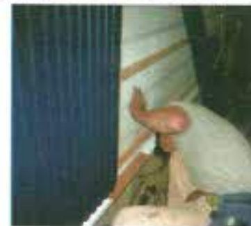
職人さんの作業の様子です。