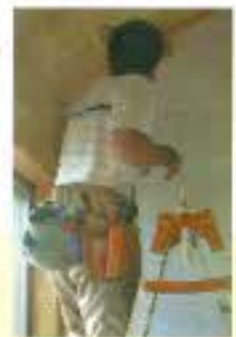
長年愛用の腰袋 道具が取り出しやすいように入っています