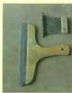
ヘラ 貼り終えたクロス のまわりを切るための道具です