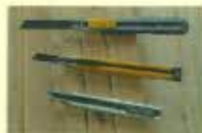
カッター 刃がうすいを使うことにより、つなぎ 目がわかりにくくなります。