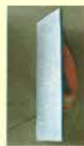
サンダー パテをかけた後 をけする道具です