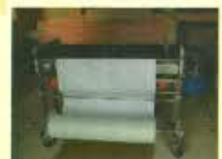
のりつけ機 長さを設定してクロス裏面にのりをつける機械です