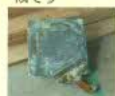
パテ板とパテヘラ