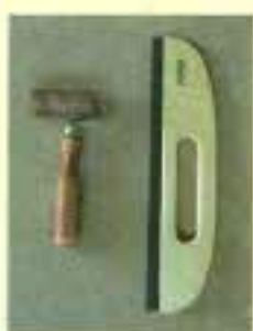
クロス用 ウレタン製のローラーと なでばけ