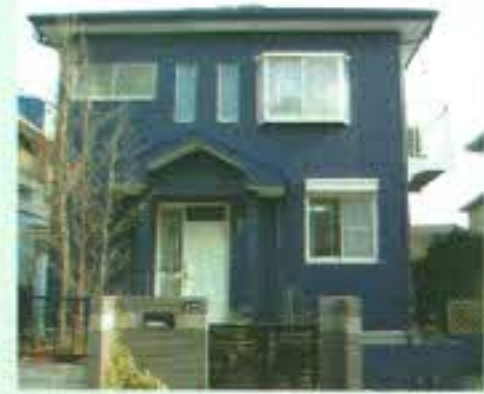
外壁を貼り終えました!