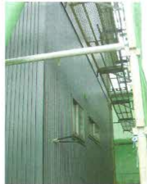
ガルバリウム材の外壁です。

2階和室の上がロフトとなりロフトの床がそのまま天井となります。2階の和室以外は梁の見える勾配天井となり、広さとゆとりを感じる2階リビングの1様邸です。