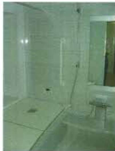
出窓付きのお風呂・・・広さを感じます。