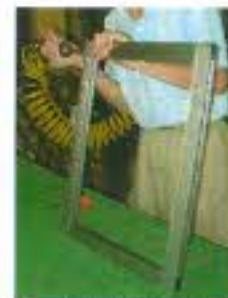
サッシの組立てをしています。