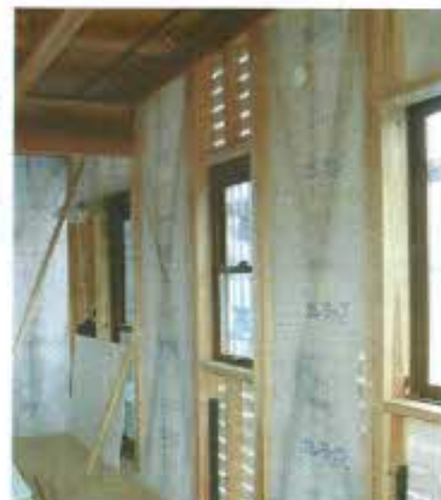
壁には。断熱材の専用シートが貼ってあります。