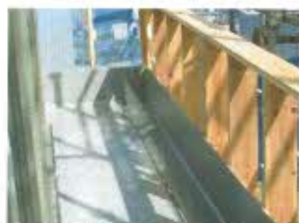
FRP防水の工事終了のベランダです。