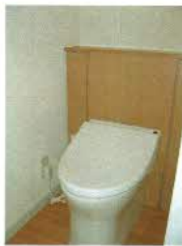
タンクが隠れているタイプのトイレですっきりとした印象です。