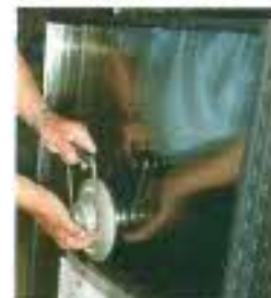
重いガラスを持ち上げる時に「吸盤」を使います。