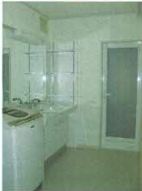
写真 上 下 家事室とつなげて広くなった洗面。 白が基調で清潔感たっぷり。

今回、リフォームをさせて頂いたのは・・・ お風呂の交換、トイレの交換、洗面所と家事室をつなげてワンルームの洗面所にし、洗面台を取替えました。居室ではないところのクロスの張り替えや広縁への物干しの設置、窓への面格子の設置・・・等々盛りだくさんでした。