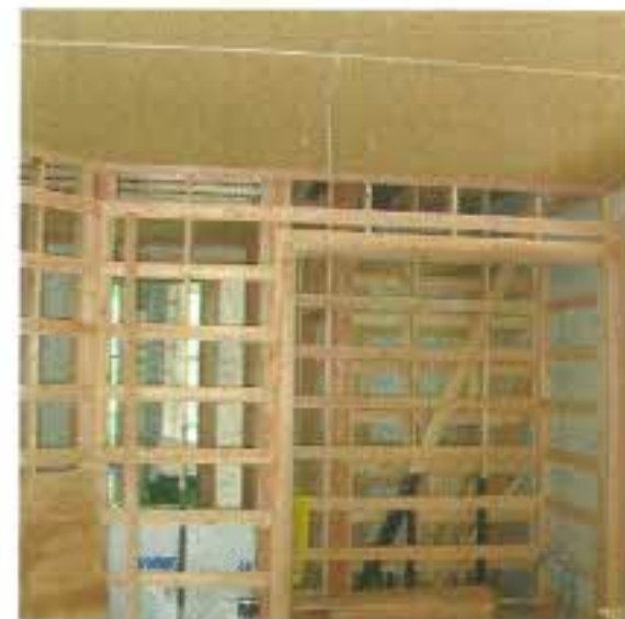
1階の壁となるところに胴ぶちが入っています。