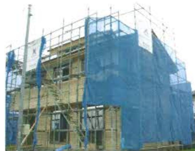
外観です。外壁は火山灰の白洲でできたそとん壁を塗ります。