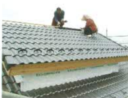
ロフトの屋根の工事です。