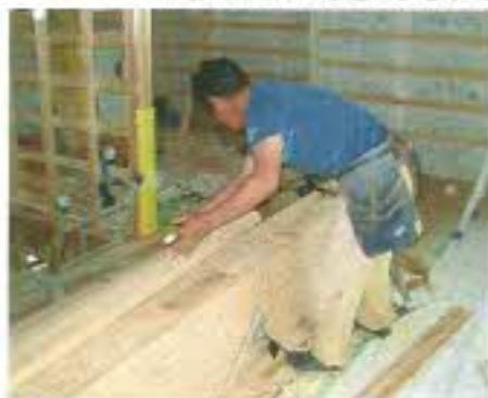
大工さんが作業をしています。