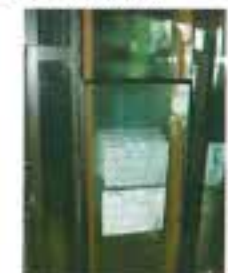
複層ガラスが並べられています。