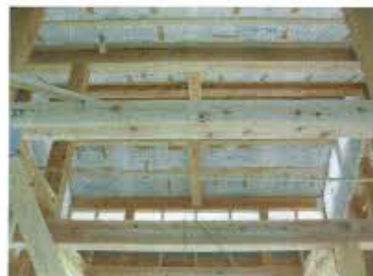
リビングは吹き抜けです。