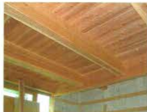
和室の天井です。上がロフトです。