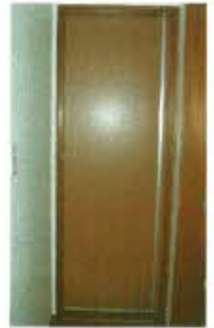
写真左が洗面所側からの扉。右が廊下側からの扉。