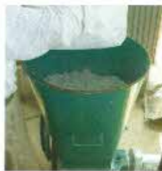
2階の壁に断熱材の吹き込みをしています。