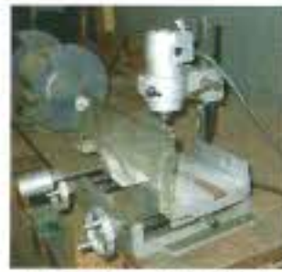
ルーター。溝をとるための機械です。