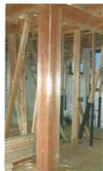
8寸のスギの大黒柱です！