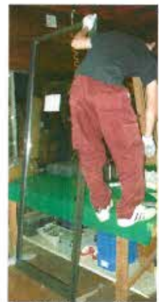
大きなサッシの組立ての時は台に上がり作業を進めていきます。