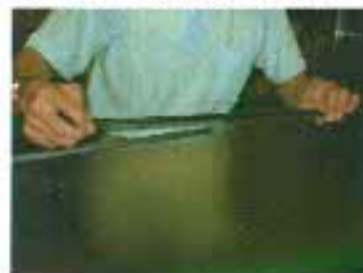
板ガラスはグレイジングチャンネルを回りに巻いてから組立てます。