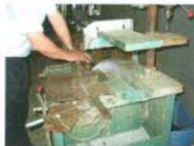
サッシの加工機。主に巾つめに使います。

定規をガラスにあてオイルカッターで切っています。オイルカッターとは油が入っていて歯が回転します。厚めのガラスに使用。少し力を入れて切ります。薄めのガラスにはダイヤモンドカッターを使います。力を入れず角度を一定に保ちながら切っていきます。