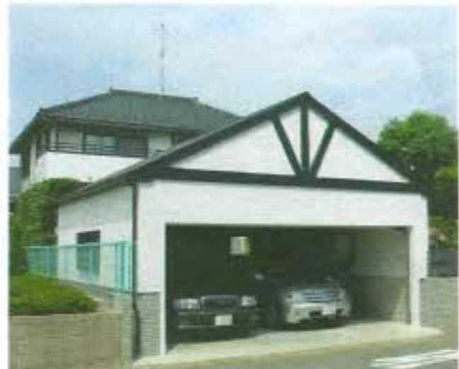
2台の車がゆったりと入っています。