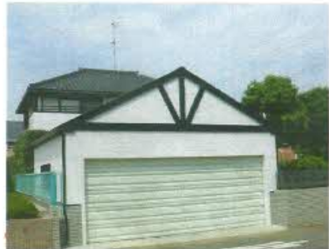
シャッターが閉まったところ。上部の黒い付け柱がポイントになっています。