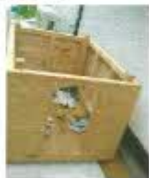
屋根を取った状態です