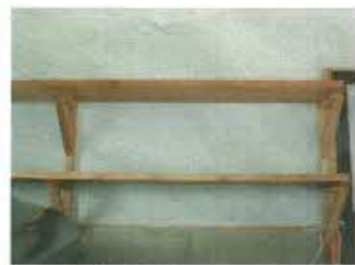
棚が2段設けてあります。