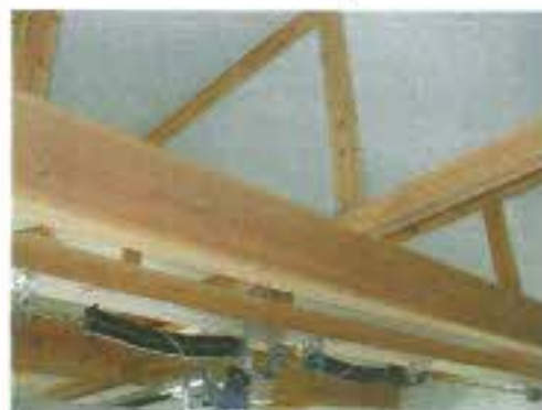
梁が見える重厚な造り