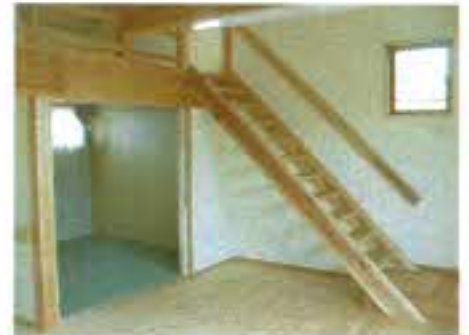
ロフトへの階段。壁に手すりを付けました。奥は4畳半の和室になっています。