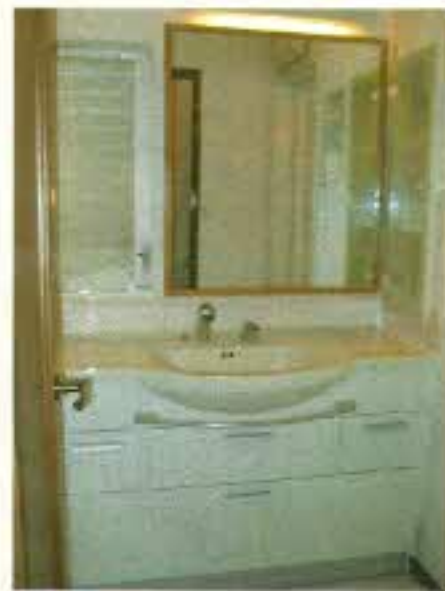
洗面所の壁はうすいピンクにしました。床下収納を付け細々したものを収めました。