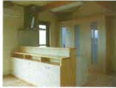
カウンター上部には吊戸棚がなくスッキリとしています。