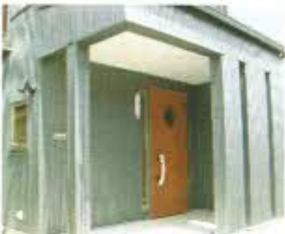
個性的な玄関扉が外観のアクセントになっています。