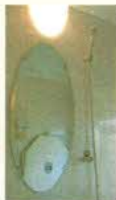
浴室の鏡は楕円形のものをつけました。