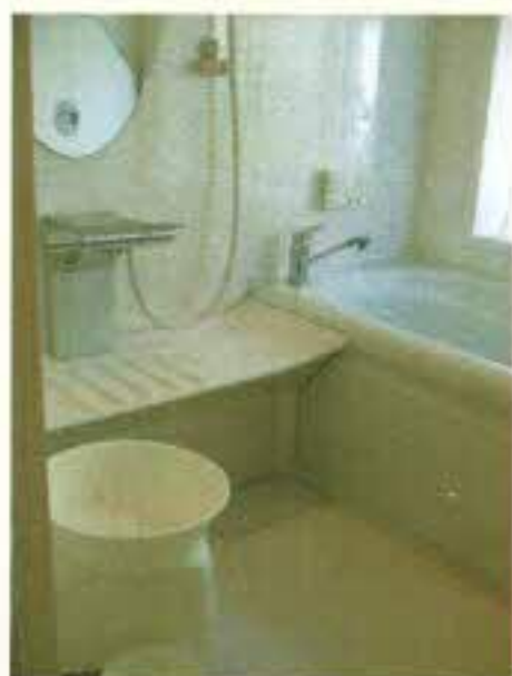
浴室はすっきりと片付いています。小物も白でまとめました。