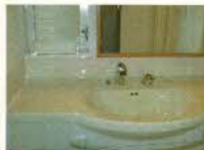
壁と洗面台のすき間はパネルを加工し、ぴったりとさせました。