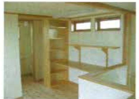
リビングの一角にパソコン用の机と本棚を設けました。