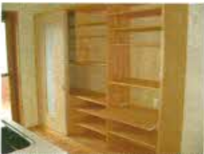
キッチン壁側に造り付けた食器棚。収納量があり重宝しています。