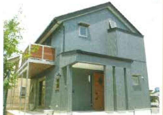
ガルバリウムを使った外壁です。