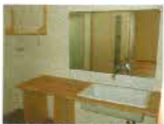
洗面ボウルは医療用で、鏡も大きいものを取付けました。