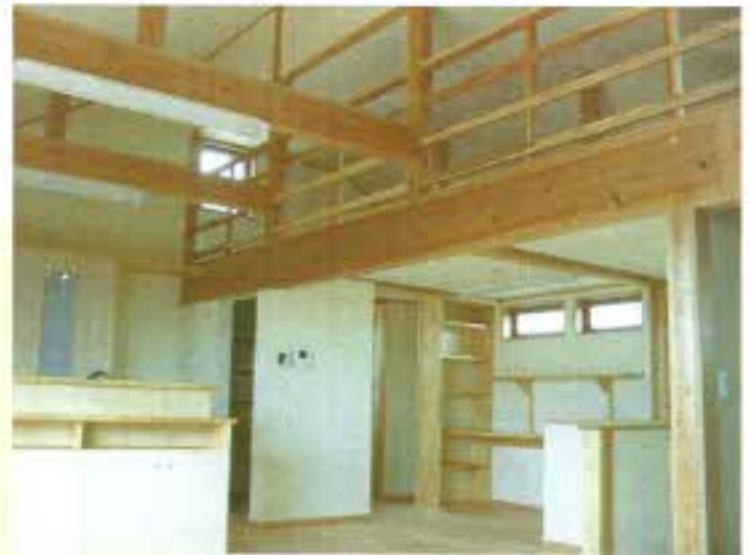
リビングからロフトを・・・梁の見える勾配天井です。

引っ越しをされて1ヶ月、新築特有のイヤな匂いもなく、快適に暮らしているとのことです。