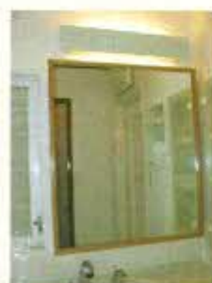
額装仕上げをした洗面所の鏡です。