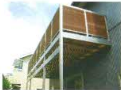
特製バルコニーを下から撮りました。