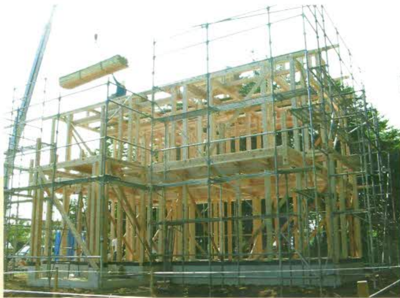
守谷市O様邸の上棟式の写真です。 柱や梁が組み合わさり、建ちあがっていく様子は壮観です。

財団法人 性能保証住宅登録機構加盟 建設業許可茨城県知事 (般-17) 第22696号 宅地建物取引業者票 茨城県知事免許(3) 第5344号