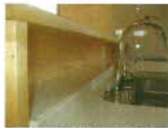
キッチン流しの前に作ったコップ置きのスペースです。