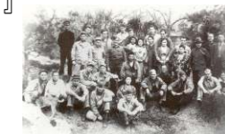
知覧にきたアメリカ兵たち

2ヶ月を経て、やがてアメリカ兵が部隊に帰るときが来た。シーブに分乗しながら別れのときが来ると、『マーマ、マーマ、さようなら！』と泣きながら手を振って去っていった・・・。