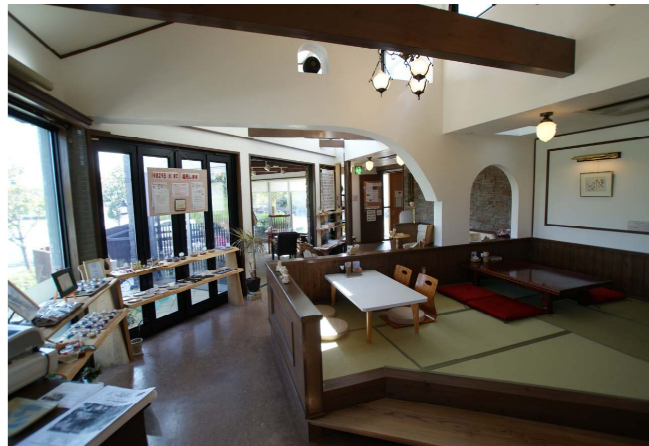
甘味 Café 空~くう~もお陰さまで、11月で二周年を迎えます。ありがとうございます。